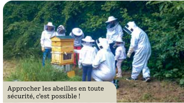
Approcher les abeilles en toute sécurité, c'est possible !