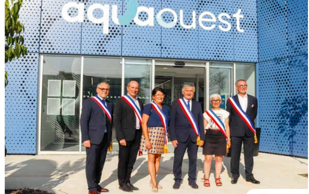
Les maires des six communes sont heureux d'inaugurer le nouveau centre aquatique intercommunal Aquaouest, ouvert depuis le 2 juillet.