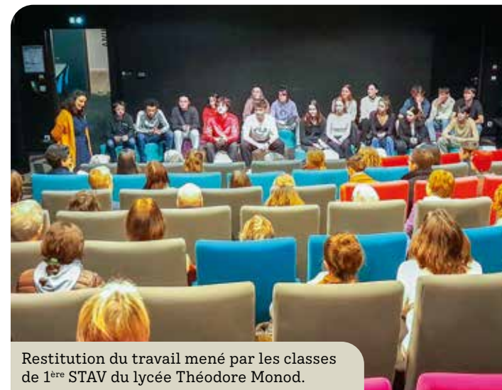
Restitution du travail mené par les classes de 1 ère STAV du lycée Théodore Monod.