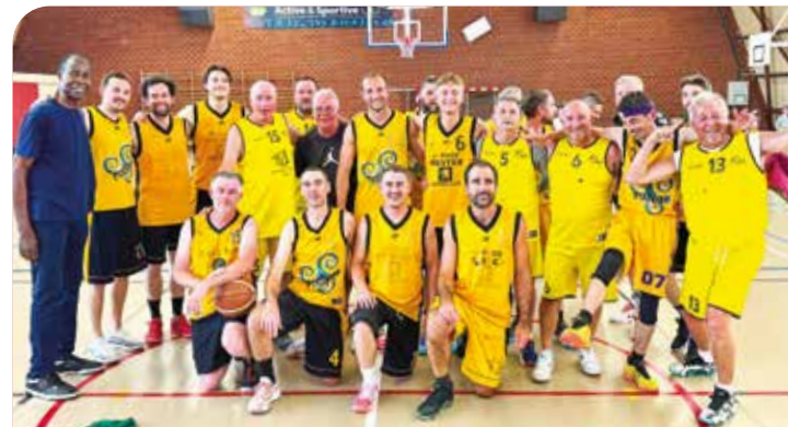
SC Le Rheu basket

section. Les familles y apportent ce qu'elles souhaitent. » Si vous voulez partager l'esprit de partage de ce collectif, n'hésitez pas, leurs portes sont ouvertes.