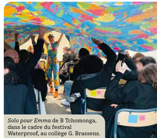
Solo pour Emma de B Tchomonga, dans le cadre du festival Waterproof, au collège G. Brassens.

** Le projet Kikoikom propose une expérience participative, artistique et citoyenne pour les jeunes, en leur permettant de contribuer activement à un événement local, tout en développant des compétences en gestion de projet, de médiation culturelle et de sensibilisation.