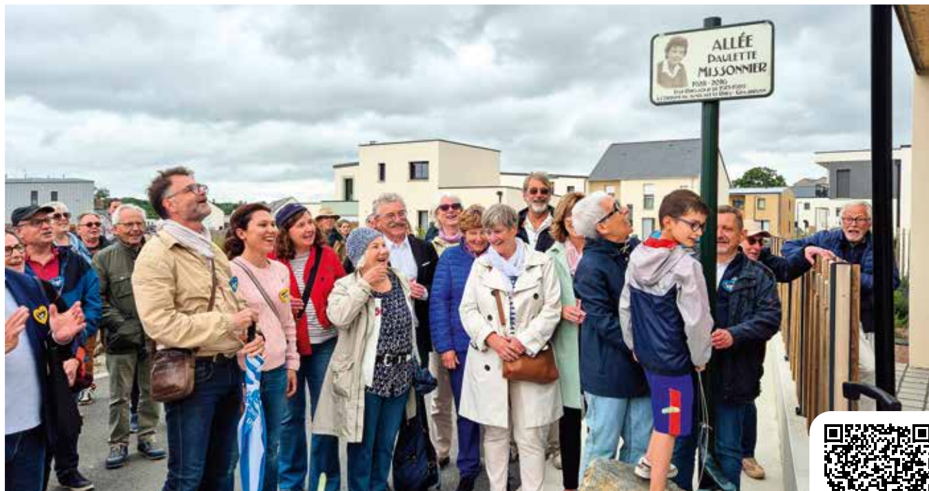
Ville de Grasbrunn