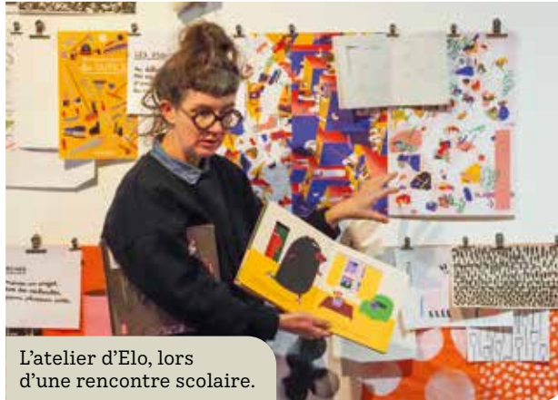
L'atelier d'Elo, lors d'une rencontre scolaire.

Axe fort de la politique municipale, la démocratie culturelle vise à permettre à toutes et tous de participer à la vie culturelle en renforçant la diversité et l'égalité*. Au Rheu, cette sensibilisation à l'art commence dès le plus jeune âge.